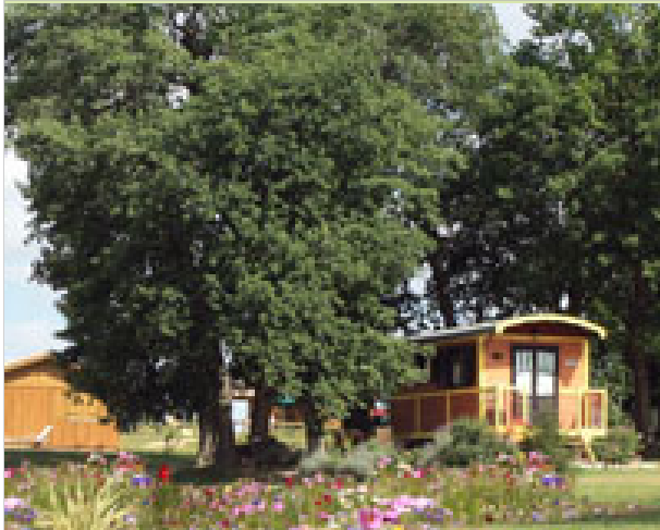
Domaine des Cadets de Gascogne - Tuko du Ramier 32500 PAUILHAC