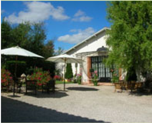
Pagayrac 32220 GAUJAC