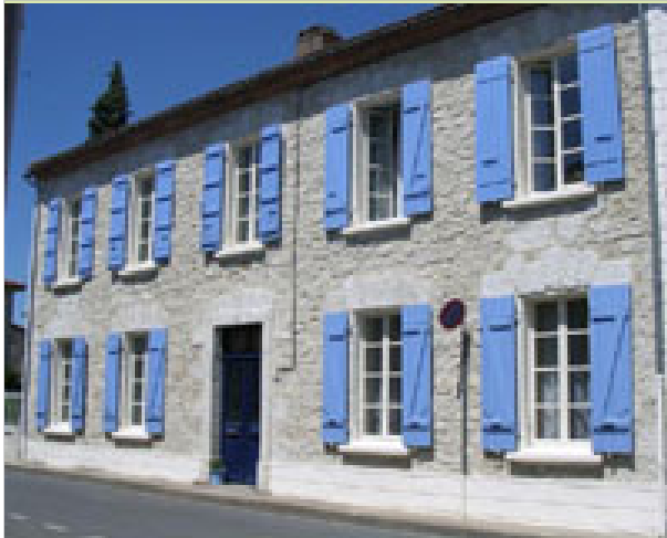
La Maison des Lys 35 grand rue 32310 VALENCE-SUR-BAÏSE