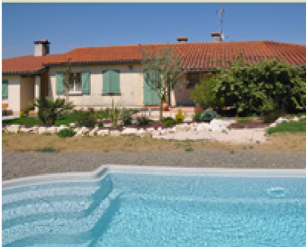
La ferme En Castéra 32450 CASTELNAU-BARBARENS