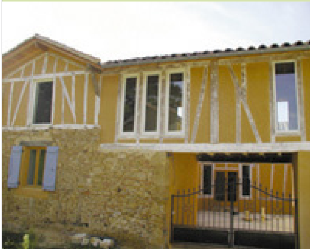
Camelire 32240 ESTANG