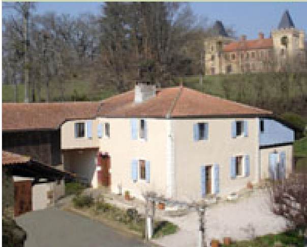
Les 3 chênes Hameau de Bernet 32140 MONLAUR-BERNET