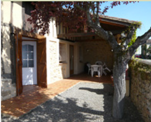
La Ferme Saint-Lanne - Le Chai Au Village 32290 SABAZAN