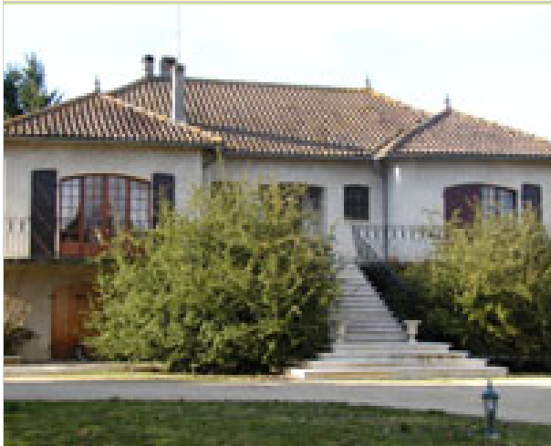
La Croisée des Vents Chemin de Morax 32100 CAUSSENS