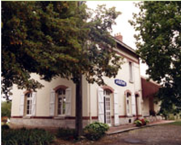
La Gare 32410 AYGUETINTE