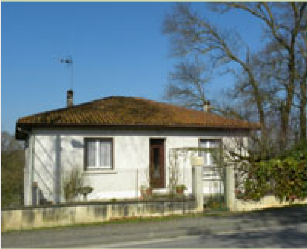
Au village - La hountete 32330 MOUCHAN