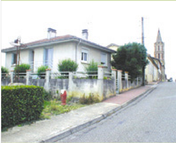
Au village Rue principale 32120 PUYCASQUIER