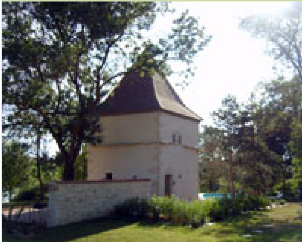
Au Pépil 32360 JEGUN