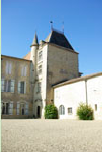
Château de Mons 32100 CAUSSENS