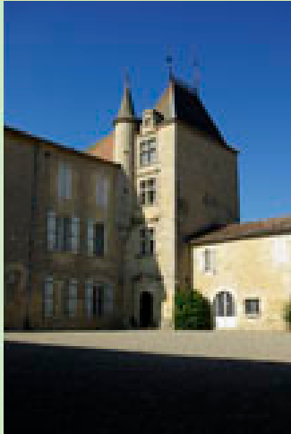
Château de Mons 32100 CAUSSENS