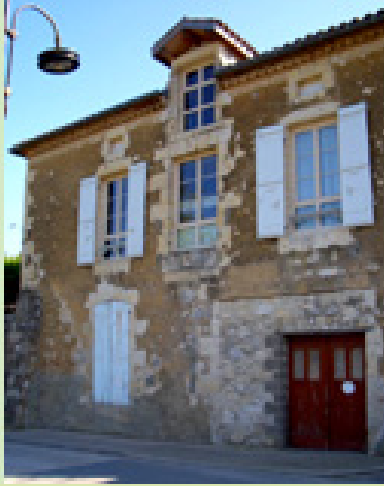
Halte Pélerine 28 rue ste Claire 32700 LECTOURE